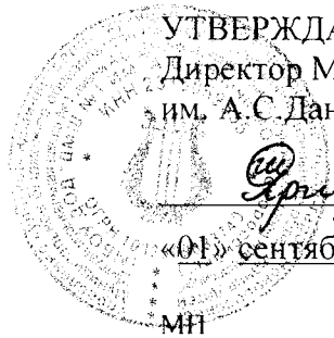
График образовательного процесса

УТВЕРЖДАЮ Директор МБОУ ДОД «ДМШ №1 им. А.С. Данини МО г.Новороссийск»